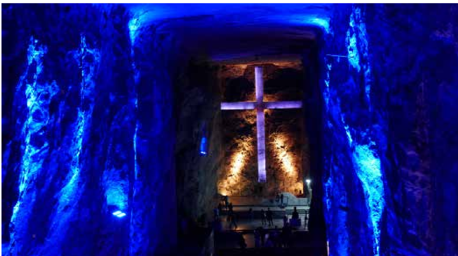
Catedral de Sal una de las maravillas de Colombia.