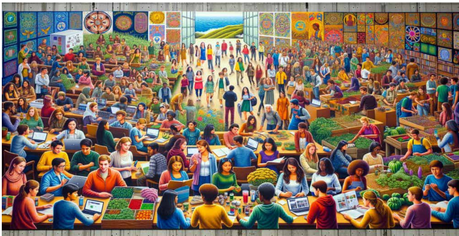
Consumo en la educación