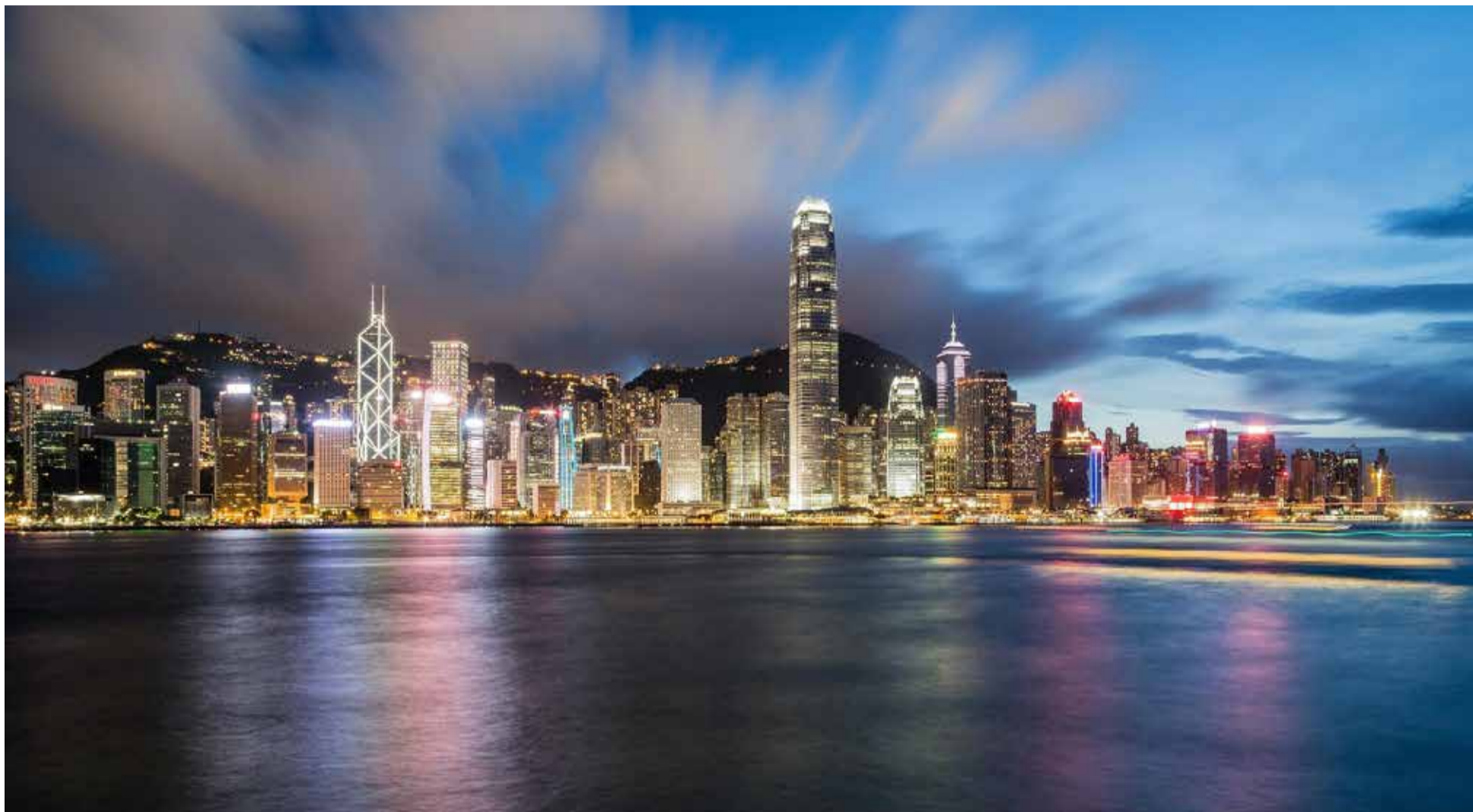
El sector financiero de Taiwán

como Argentina, Brasil, Chile, México y Perú son socios muy activos con Taiwán y presentes en la Isla, pese a no tener vínculos diplomáticos.