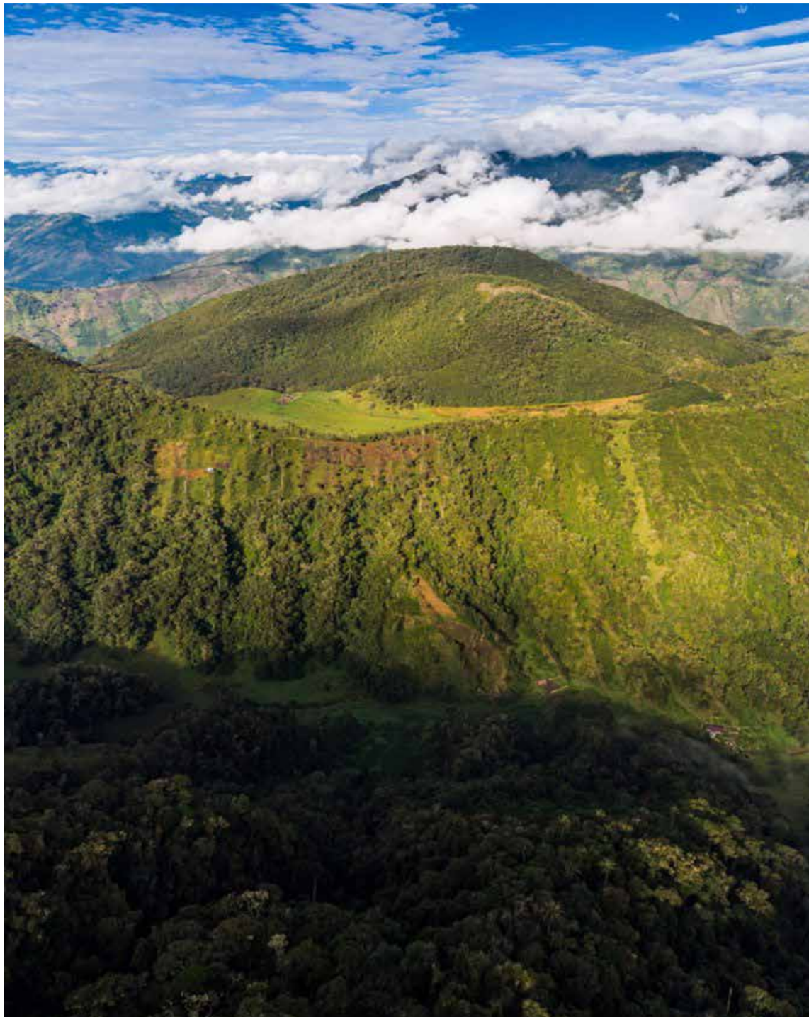
Volcán Cerro Machín

* Enterramiento y aislamiento pasivo y tardío de grandes extensiones de terreno (cerca al cauce y por fuera de él) incluida la infraestructura ubicada sobre las mismas. * Relleno de cauces naturales y artificiales. * Inundación de las regiones aledañas en el caso