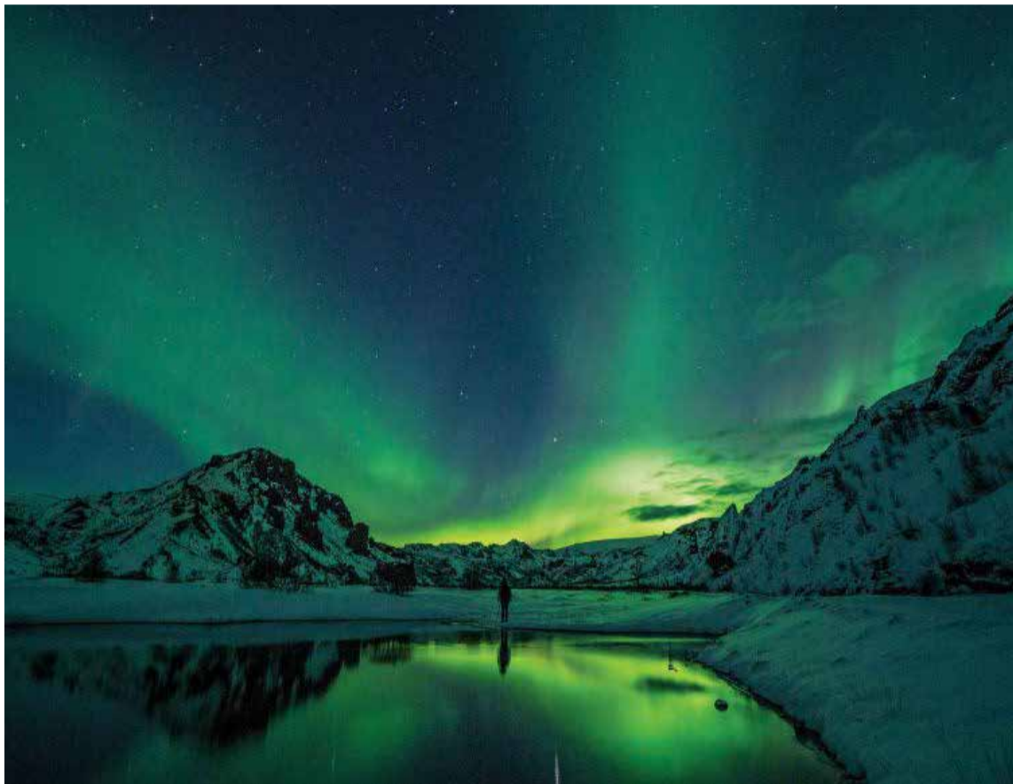
Grande y poderoso el egoísmo y la mezquindad de unos pocos, para dar cabida a todos como raza humana.

Muchos pensaron que este siglo iría a la par con los grandes logros que la ciencia y la tecnología han traído para dar felicidad a los seres huma-