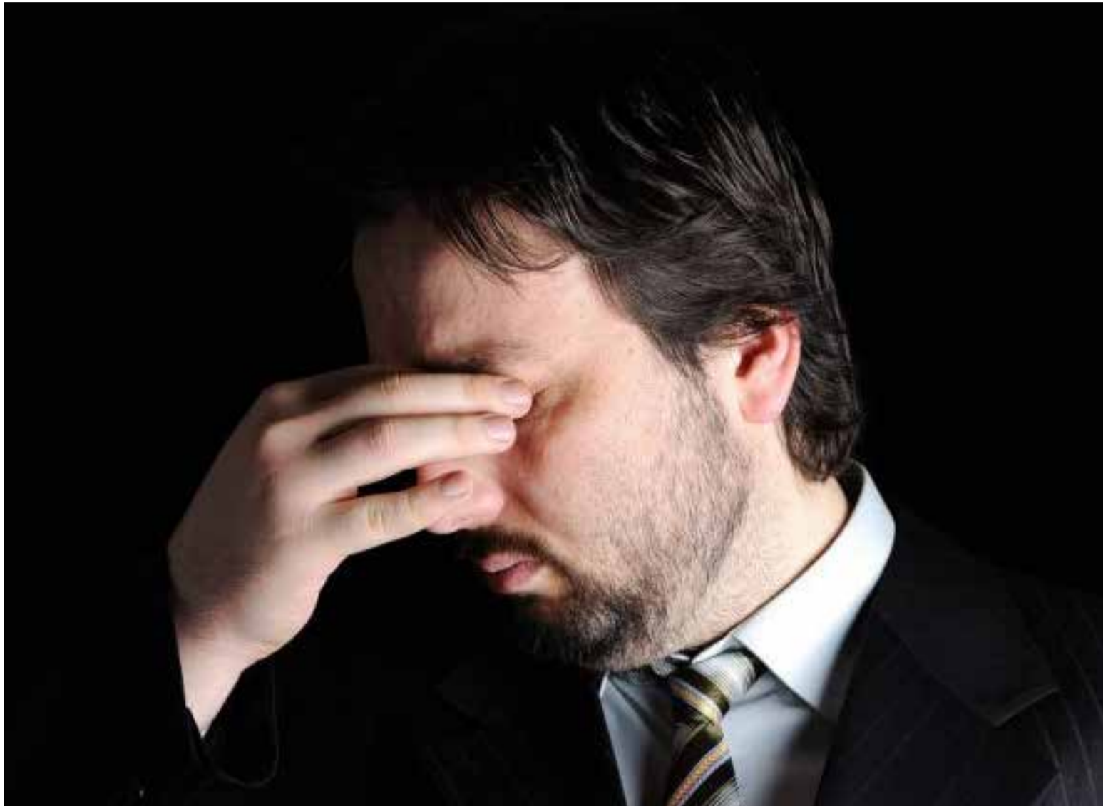
Las emociones pueden generar o producir niveles altos en relación al dolor físico, por lo que la conexión mental y fisiológica, desencadena una dependencia simbiótica.

Para el profesional de la salud, separar ambas orientará mejor al paciente a una adaptación y comprensión sintomáti-