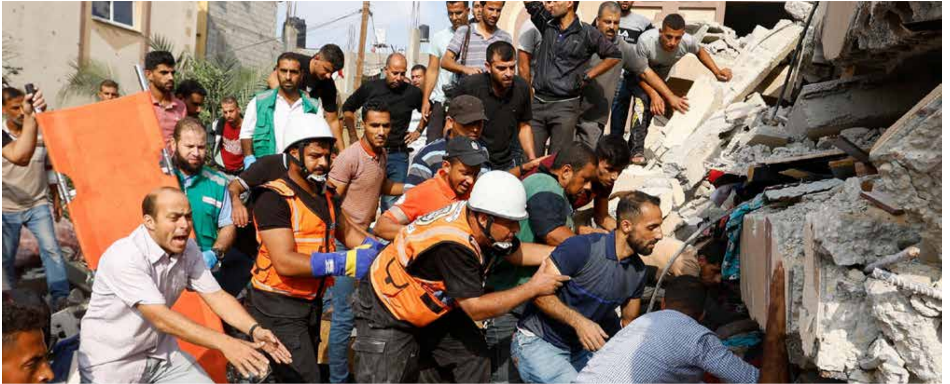
La guerra se acerca a los 50 mil muertos.