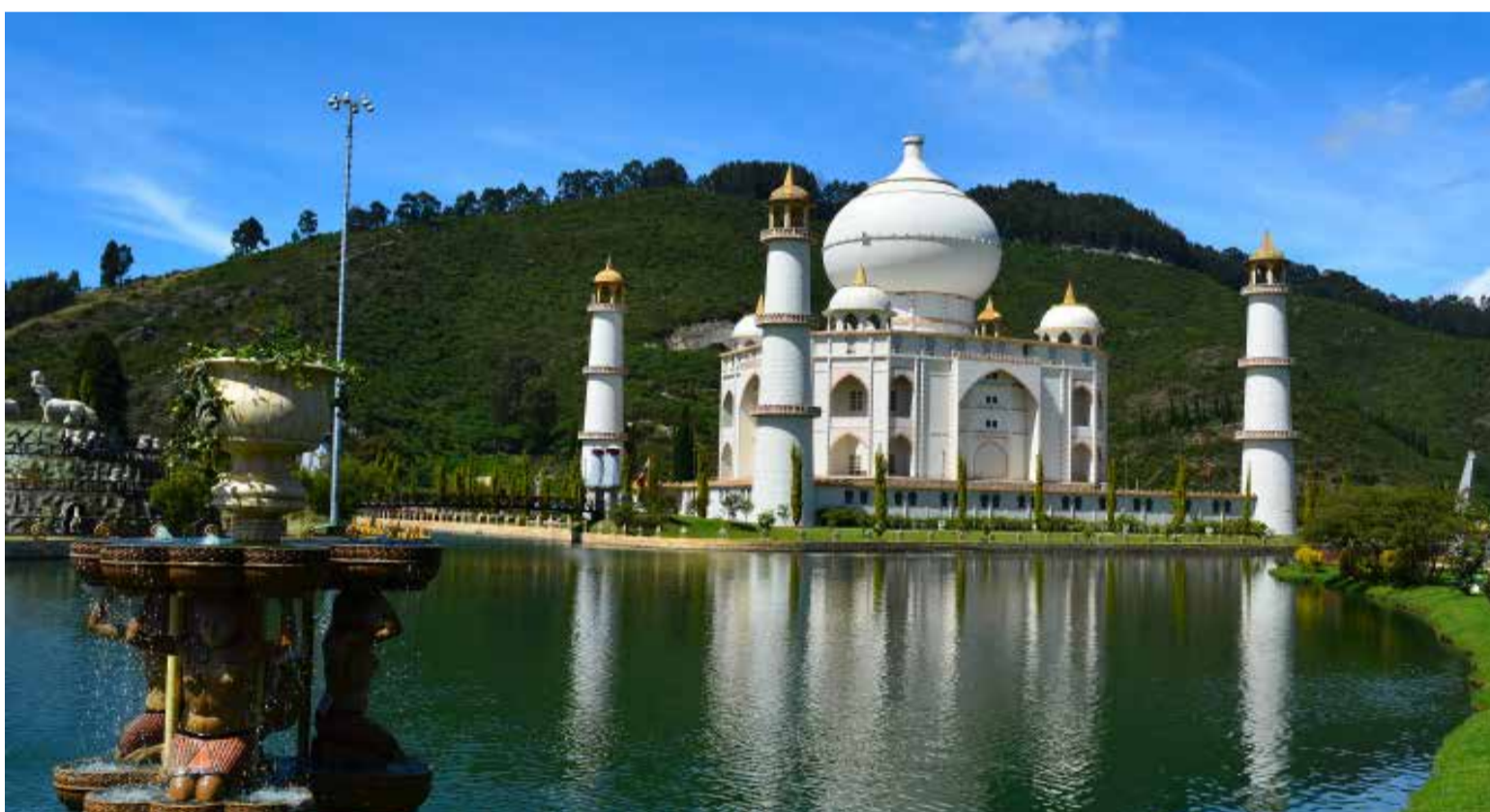
Parque Jaime Duque donde se levanta una replica del Taj Mahal.

Es importante señalar que, si bien en el periodo comprendido entre los años 2020-2021 debido a la pandemia por la Covid-19 la población en condiciones de pobreza monetaria aumentó en el país. En Cundinamarca las cifras fueron más alentadoras ya que pasó de tener en 2020 un porcentaje del 27%, es decir 785 mil personas pobres en materia monetaria, a registrar un importante descenso en 2021 con un porcentaje de 22.8%, equivalente a 673 mil; esto representa que 112 mil cundinamarqueses alcanzaron un ingreso superior a los $290.000.