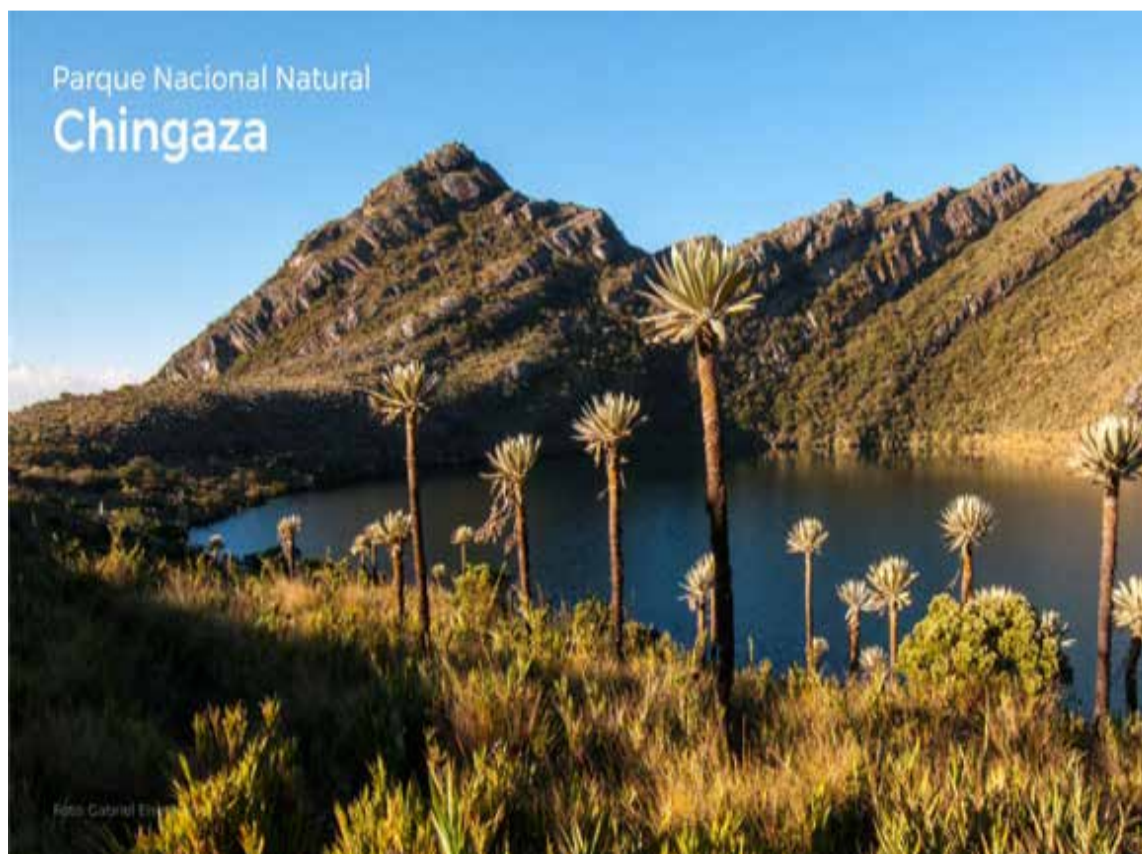
Parque Nacional Chingaza

Por esa razón, los expertos de Baterías Mac les proponen a los conductores colombianos, planear sus días de descanso en lugares que le permitan disfrutar del país y sus paisajes de una forma di-