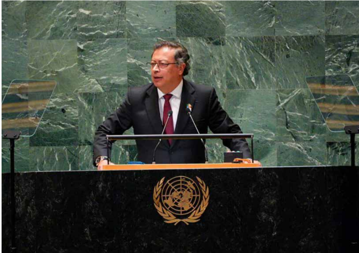
Gustavo Petro presidente de Colombia en la ONU

• En este recinto la capacidad de comunicación de un presidente depende de la cantidad de dólares que tenga en su presupuesto. En la cantidad que tenga de aviones de guerra y en el fondo en la ca-