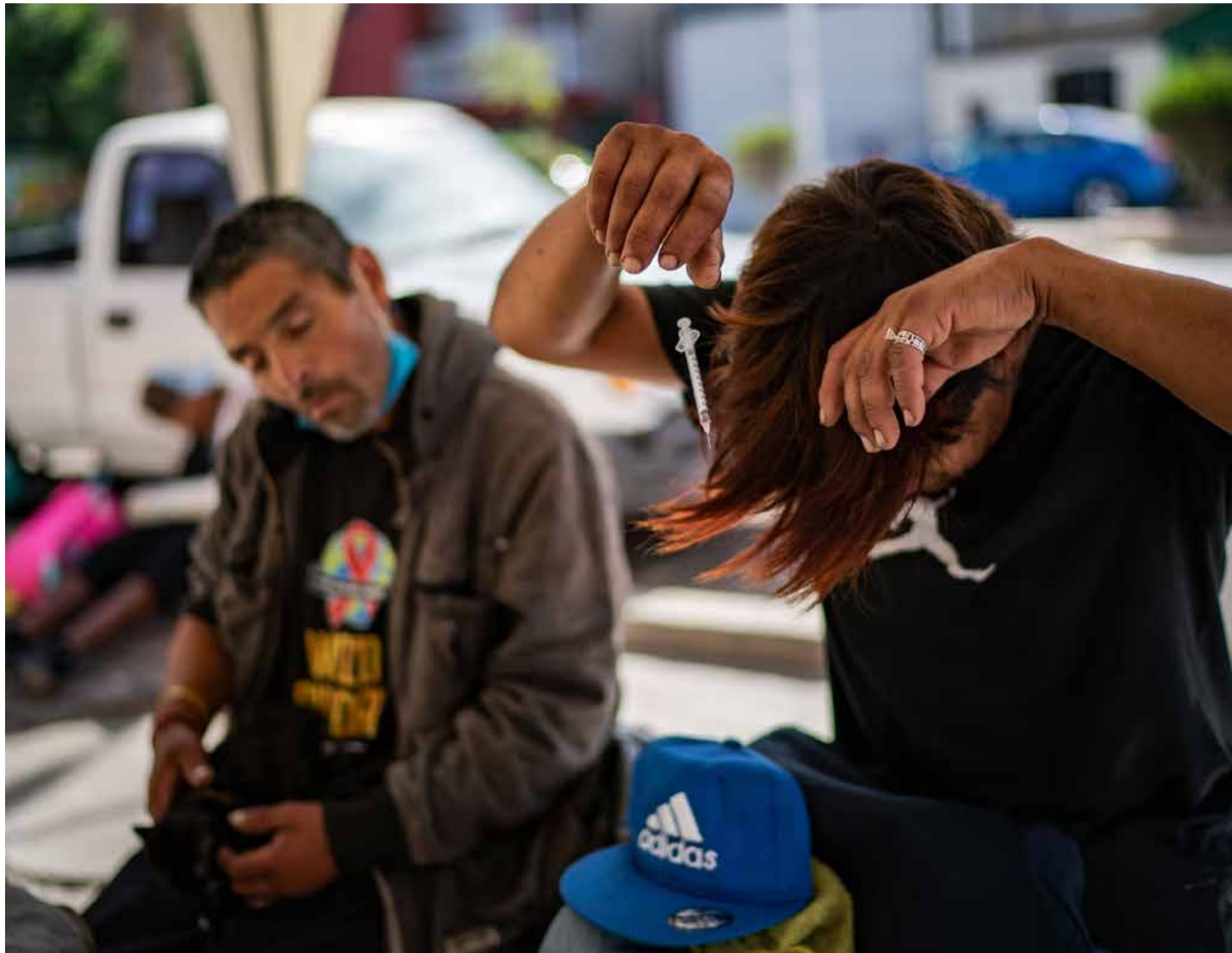
El fentanilo convierte a los consumidores en «zombis»